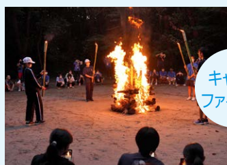
キャンプファイヤー