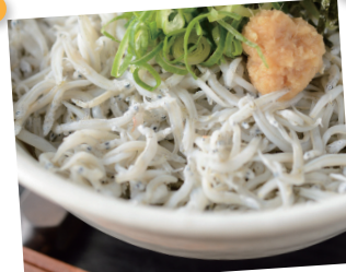
噛むたびに旨みと口の中で広がる 『しらす』