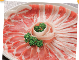
一味違う旨みと柔らかさ 『黒豚』