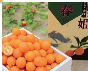
糖度が16度以上 『きんかん春姫』