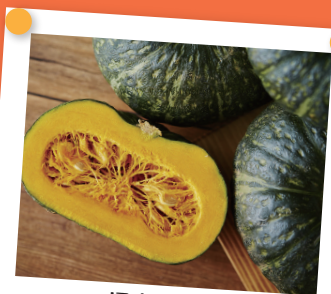
ほくほく甘い 『加世田のかぼちゃ』