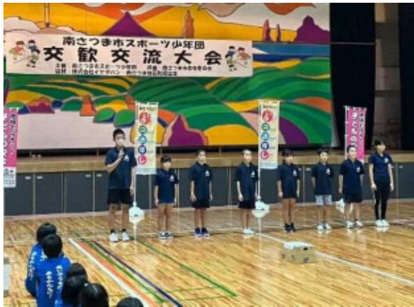
交歓交流大会（南薩地区）