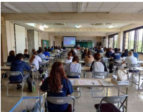
指導者・育成母集団研修 講話「子どもを熱中症から守るためには」 （肝属地区）