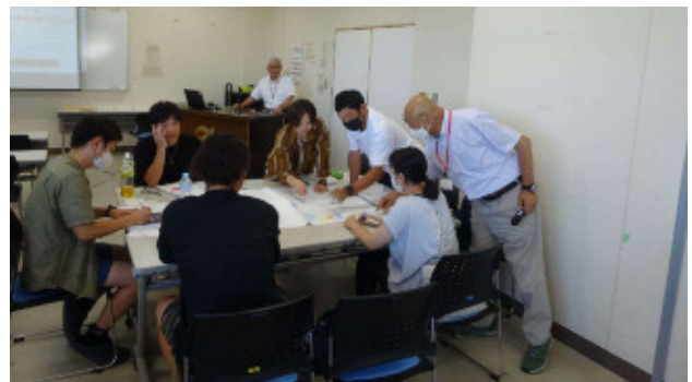
スタートコーチ（スポーツ少年団）養成講習会