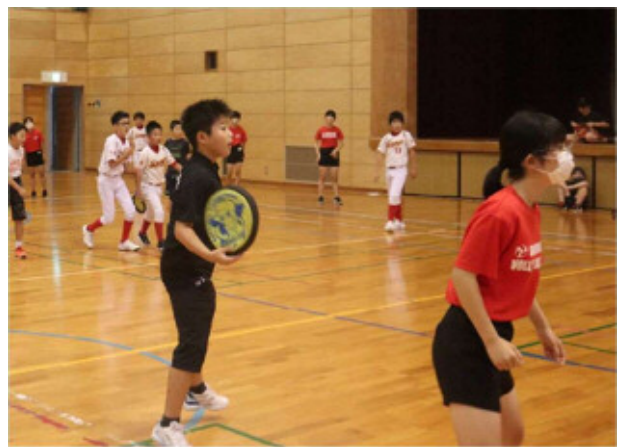
レクリエーション大会（熊毛地区）