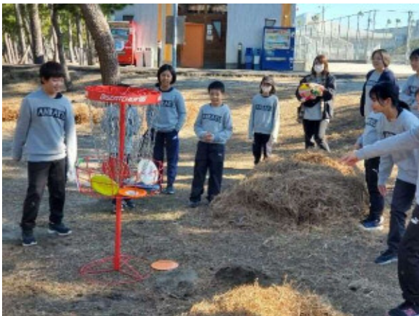
「フライングディスク」交流大会（曾於地区）