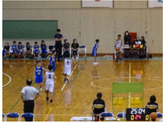
ミニバスケットボール