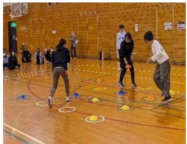
指導者・育成母集団研修 「ACP実技研修」 （鹿児島地区）