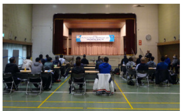
ACP（アクティブ・チャイルド・プログラム）普及促進研修会