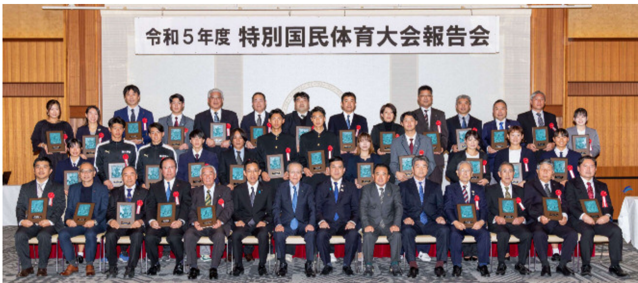
公益財団法人鹿児島県スポーツ協会表彰式 (令和5年12月14日)