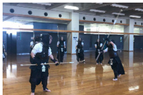
公認コーチ1養成講習会（なぎなた競技）