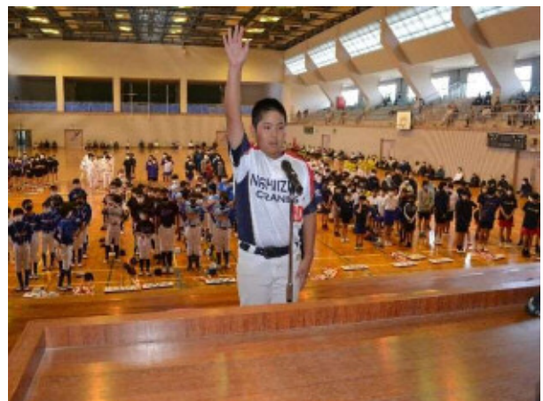
結団式 宣誓のことば（北薩地区）