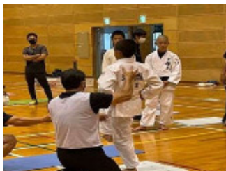
＜熊本地区＞ 「育成期の体幹トレーニング」研修