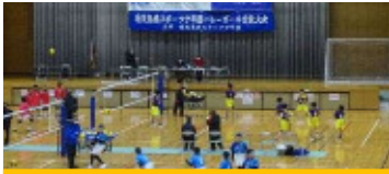
バレーボール 12月18日