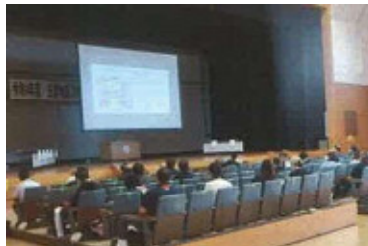
＜日置地区＞ 「アクティブ・チャイルド・プログラム研修」