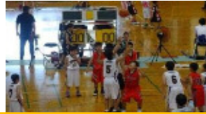
ミニバスケットボール 7月2・3日