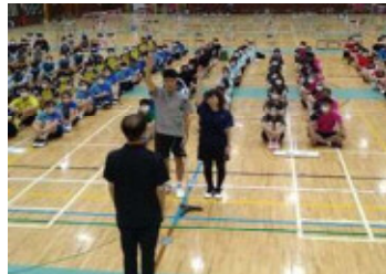
【バドミントン競技】