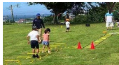
【未就学児・小学校低学年スポーツ教室の様子】

NPO法人 沖永良部スポーツクラブEloveは、「小さな島でもでっかいスポーツ環境！」をスローガンに、2018年誕生しました。沖永良部島における豊かなスポーツ環境の実現を目指し、島民に寄与するスポーツ振興と地域活性化を図ることを目的とし、日々島民と共にスポーツを通じたコミュニケーションの場を提供しています。