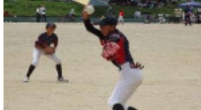
ソフトボール 7月24日