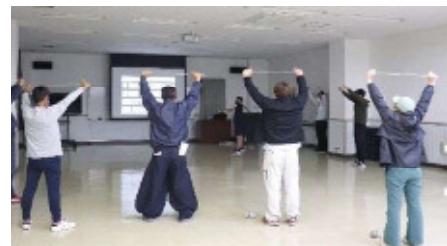
＜北薩地区＞ 「からだの使い方とストレッチの重要性」